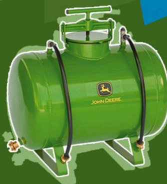
Filter für Grundwasser und Oberflächenwasser